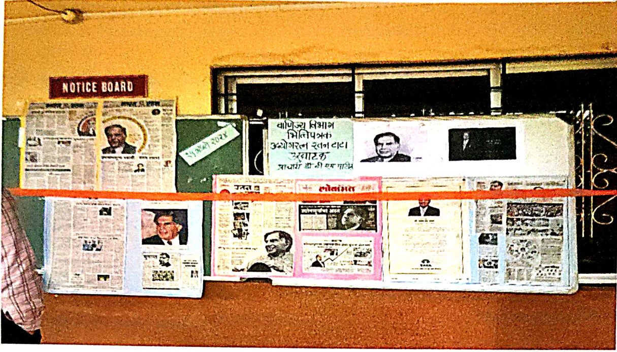
“उद्योगरत्न रतन टाटा यांच्या जीवनावर आधारित भित्तिपत्रक” या विषयावर आयोजित भित्तिपत्रक